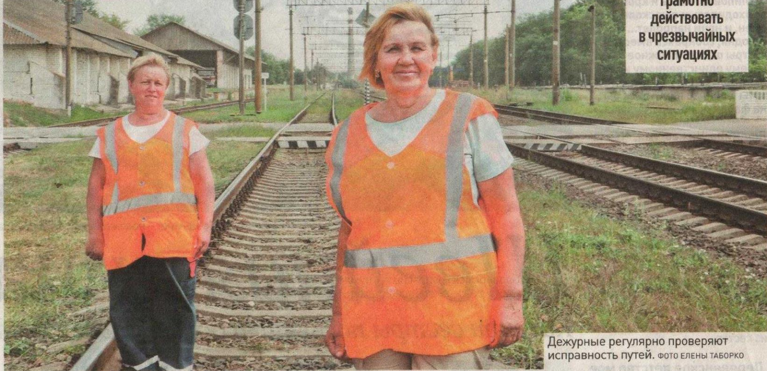
Дежурные регулярно проверяют исправность путей.

Дежурный по переезду должен уметь брать на себя ответственность, быстро и грамотно действовать в чрезвычайных ситуациях