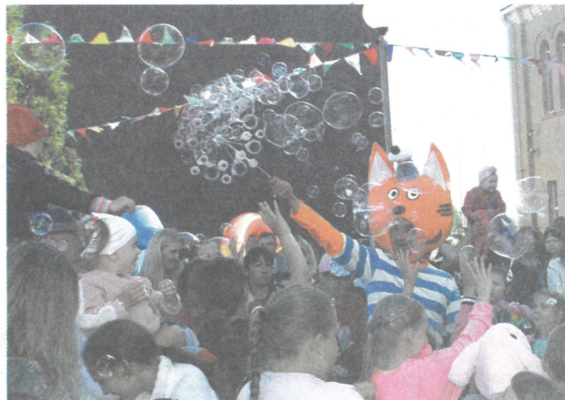
Шоу мыльных пузырей