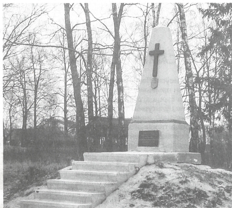
Помнік ахвярам ПСВ у Залессі.

Ваенна-санітарныя цягнікі прызначаліся для перавозкі параненых і хворых, былі рухомымі шпіталямі ў ваенны час. Іх фарміраваннем займалася, акрамя ваеннага ведамства, адна з буйнейшых грамадскіх арганізацый – Усесаюзны земскі саюз дапамогі хворым і параненым (УЗС). Сярод усіх чыгуначных транспартаў УЗС санітарны цягнік з нумарам 218 вылучаўся гісторыяй свайго ўзнікнення і выключным характарам работы. Ён сфармаваўся 13 (26) лістапада 1914 года на паўночна-заходнім фронце як вузкакалейны цягнік. Быў прызначаны абслугоўваць эвакуацыю параненых, падвозячы іх да цягнікоў шырокай каляіны. Спачатку ён лічыўся толькі прыдаткам да цягніка №187 і меў назву №187-біс. Складаўся ўсяго з некалькіх вагонаў, якія курсіравалі паміж Граевам і Лыкам ва Усходняй Прусіі. Пазней цягнік, ужо добра абсталяваны, абслугоўваў з лютага 1915 года Асавец і заставаўся пры крэпасці да апошніх дзён яе існавання. У гэты перыяд ён выконваў даволі кароткія рэйсы з крэпасці Асавец да Беластоку, чым пацвярджаў назву “галаўны”, г. зн. разлічаны на работу выключна палізу фронту дзеючай арміі ці нават на самой перадавой. Пры вялікай інтэнсіўнасці работы, з пачатку першага выхаду і да 1(14) верасня 1915 года, цягнік зрабіў 121 рэйс і перавёз 16 429 чалавек.