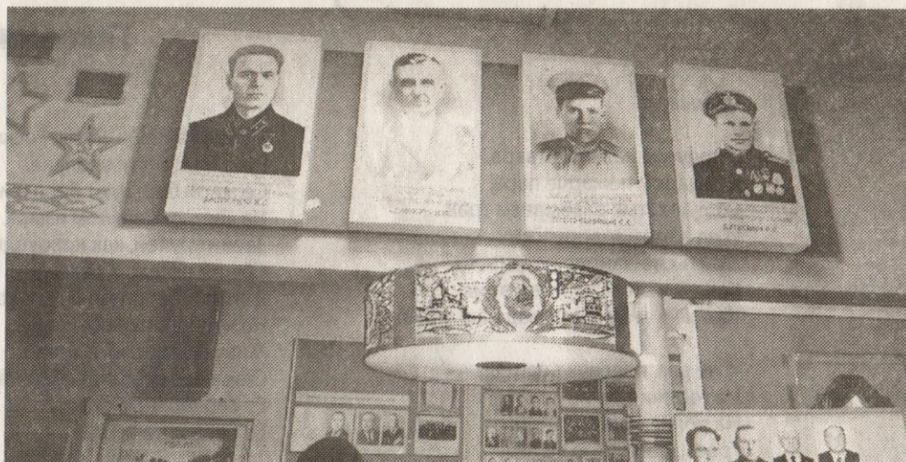
Из экспозиции музея локомотивного депо