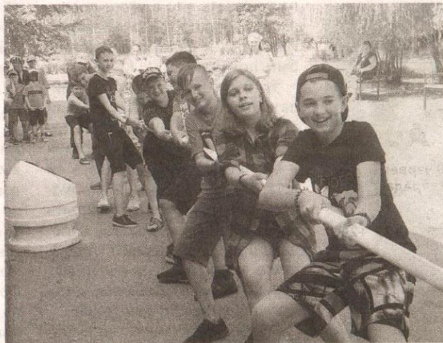
Показывали спортивную сноровку

Для предупреждения детской гибели и травматизма в рамках акции «Каникулы без дыма и огня» спасатели Оршанского ГРОЧС и представитель Оршанской водолазно-спасательной станции ОС-ВОД посетили детский оздоровительный лагерь «Лесное озеро». Они подготовили для ребят познавательно-развлекательную программу. В актовом зале спасатели рассказали об основных правилах поведения при чрезвычайных ситуациях, напомнили номера экстренных служб, а также о важности установки пожарных извещателей. Начальник Оршанской спасательной станции рассказал, какие