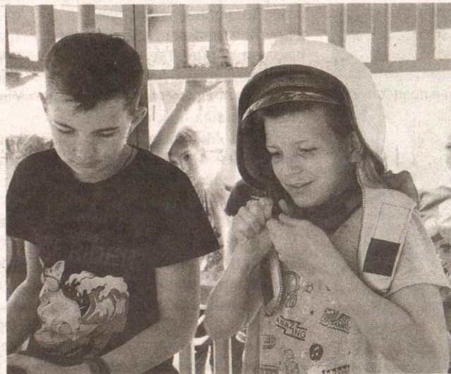
Представляли себя спасателями

опасности таят в себе водоемы и как вести себя детям и взрослым во время пляжного отдыха, чтобы не стать жертвой воды.