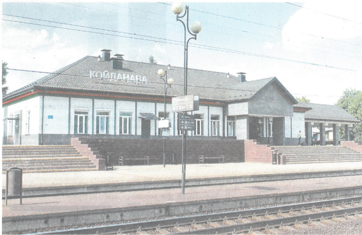
В 2019 году на станции и прилегающей территории был проведен капитальный ремонт