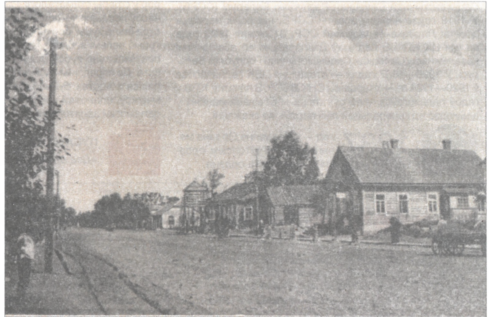
Маладзечна. Замкавая вул. 1930-я гады.