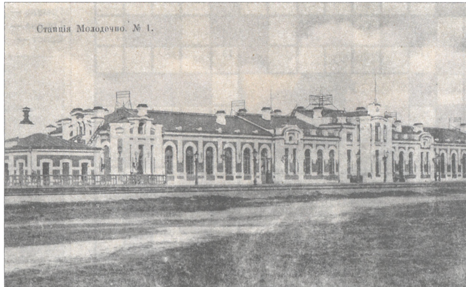
Маладзечна. Вакзал (пач. XX ст.).

Міхаіл Васільевч, ад прыроды чуйны да мастацкіх вобразаў, уважлівы да дэталей, вельмі пільна ўглядаўся ў літоўска-беларускае памежжа: «Я ехаў па шырокай раўніне, якая на гарызонце акаймлялася лесам. Сонца ўжо пераваліла далёка за поўдзень, калі я ўбачыў наперадзе характэрныя літоўскія могілкі, на ўзгорку, абнесеныя агароджай з валуноў, зарослыя старымі высокімі соснамі, сярод якіх, спаборнічаючы з імі ў росце, высіліся надмагільныя крыжы, знаёмыя нам па карцінах Чурлёніса. Направа ад могілак віднелася панская сядзіба, а ўдалечыні на гарызонце маячыла ўскраіна чарналесся, масіў якога мне трэба было перасекчы...» І яшчэ: «...засірнуў за агароджу могілак і ўбачыў на некалькіх помніках свежыя вянкi, букеты жывых кветак, пэўна, нядаўна пакладзеныя на магілы. Асаблівае замілаванне выклікалі маленькія букецікі, якія былі сабраны і пакладзены на магілы, несумненна, дзіцячымі рукамі. Колькі трэба мець самавалодання, каб пры паспешлівых уцёках наведць дарагія магілы!»