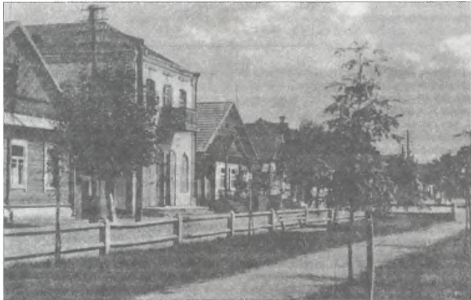
Маладзечна. 1930-я гады.