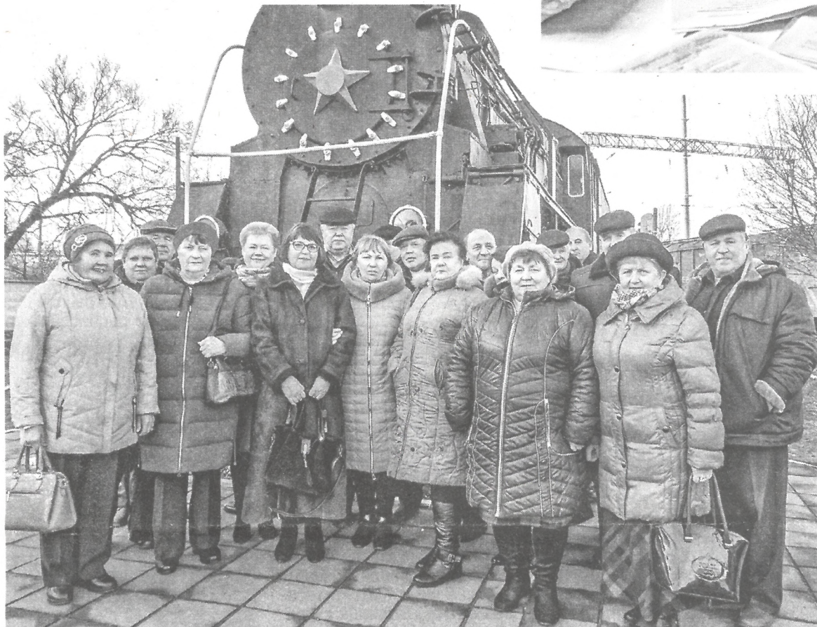
Для ветеранов локомотивного депо памятник паровозу – символ преемственности поколений и верности любимой профессии.