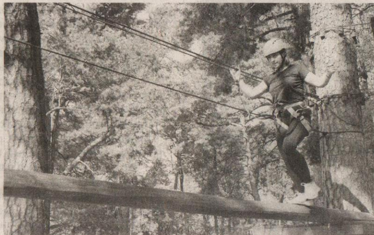
Преодоление веревочного городка

Как отметили участники квеста, самым сложным испытанием стало преодоление веревочного городка. Многие впервые покоряли высоту, поэтому и впечатления были особенно сильные. Самым же веселым этапом стал турнир по лазертагу, в котором, несмотря на усталость, каждый старался поразить соперника и привести команду к победе.